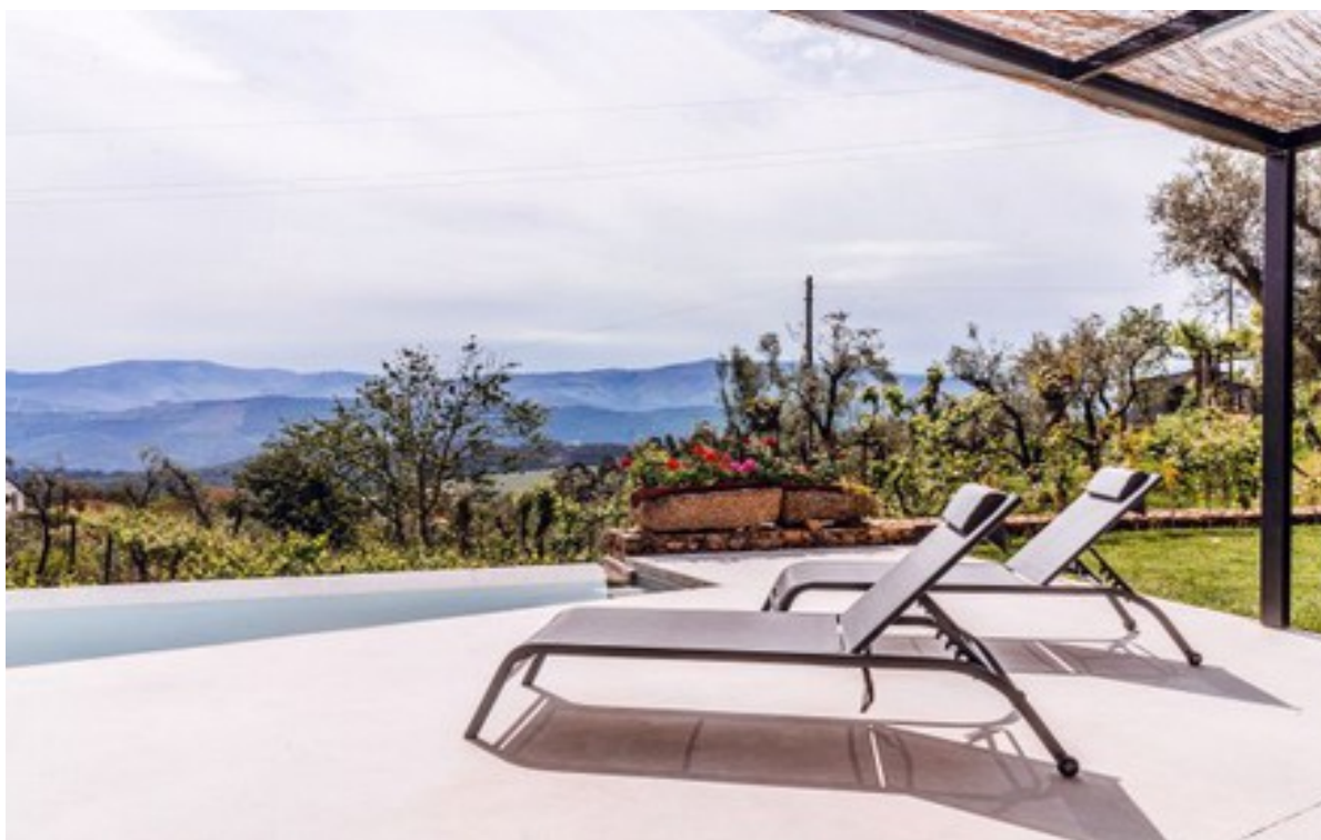
Vistas da Piscina