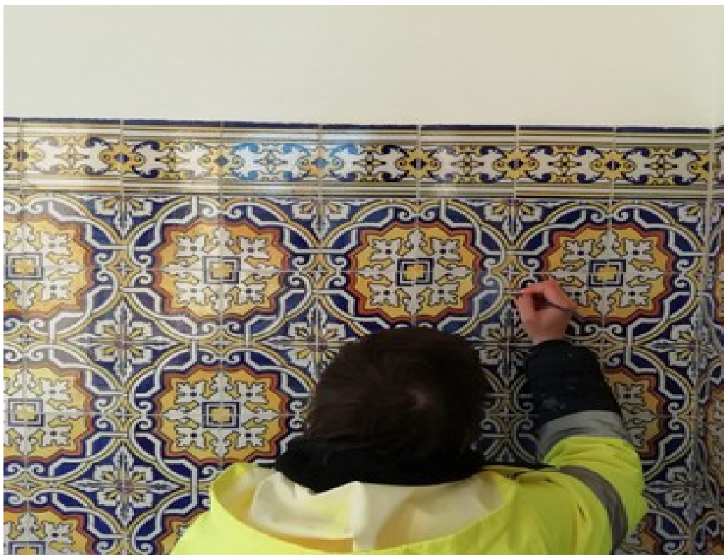
Recuperação de azulejos - estação de Lourido-2