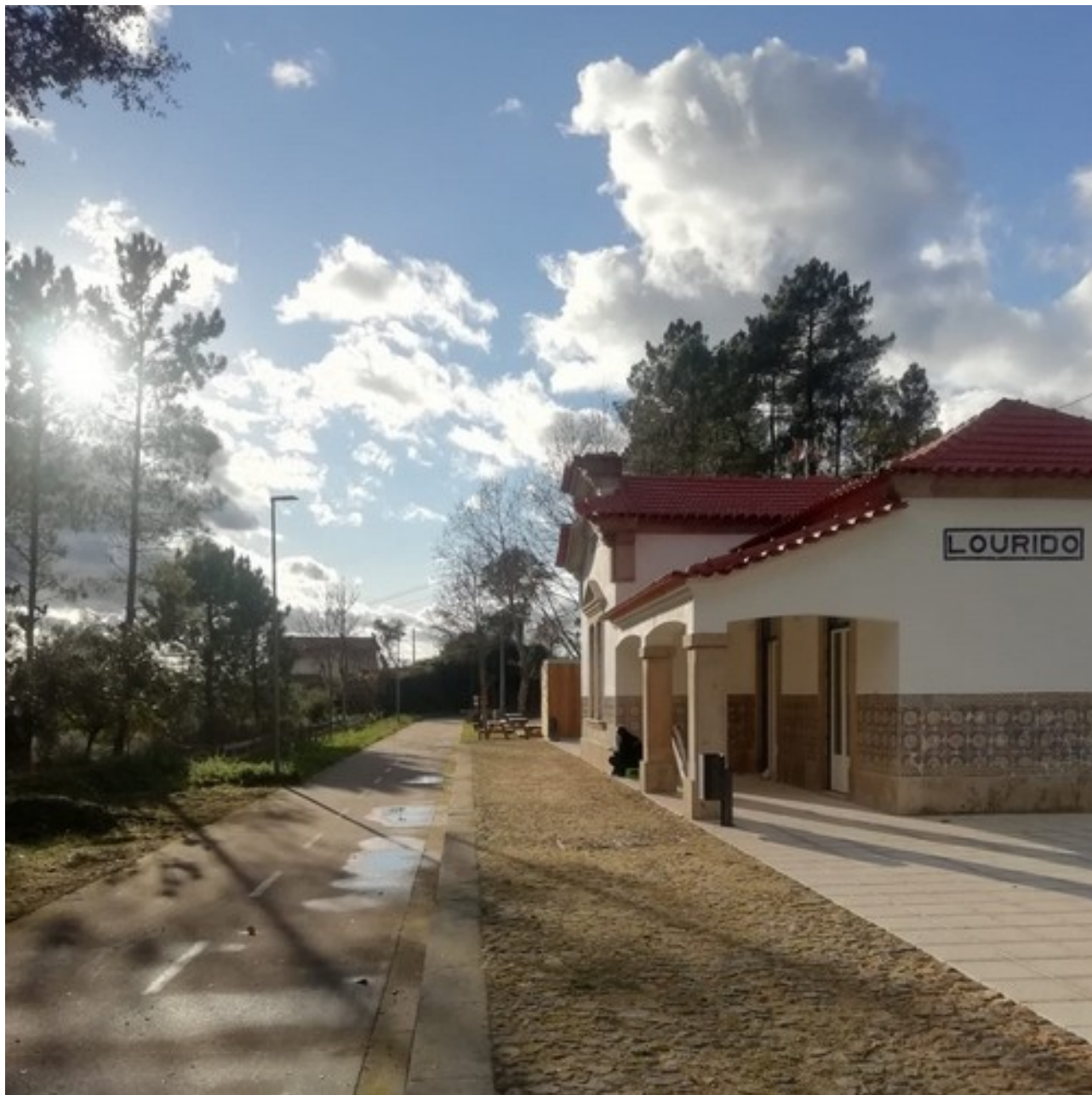
Recuperação de azulejos - estação de Lourido-4