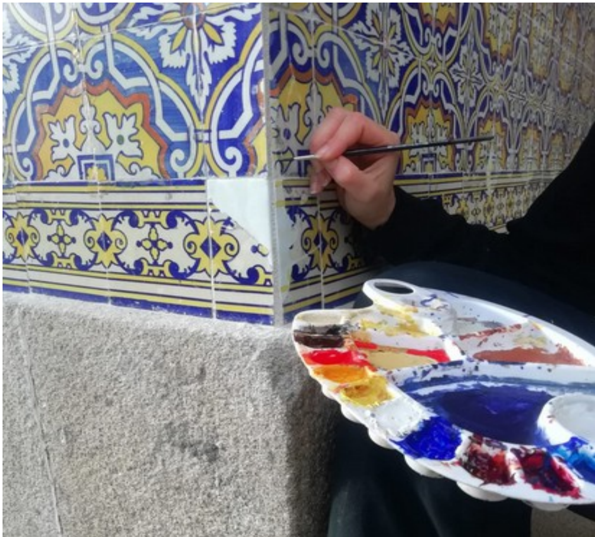
Recuperação de azulejos - estação de Lourido

O Município de Celorico de Basto pretende intervencionar o património azulejar existente ao longo da antiga linha ferroviária da linha do Tâmega, nomeadamente nas estações de Canedo (que se localiza na freguesia de Canedo de Basto), Mondim (que se localiza na União de Freguesias de Veade, Gagos e Molares), Codeçoso (que se localiza na freguesia de Codeçoso) e no Apeadeiro de Lourido (que se localiza na freguesia de Arnoia), necessitando do apoio indispensável do programa para alavancar o investimento destas intervenções.